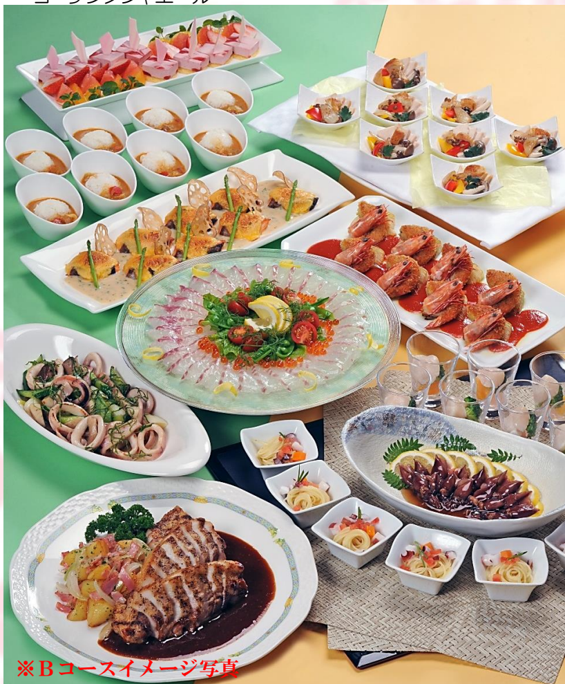
※Bコースイメージ写真

ビール・芋麦焼酎・ウイスキー・ハイボール・日本酒・赤白ワイン ・梅酒・ノンアルコールビール・ウーロン茶・オレンジジュース ・コーラ・ジンジャール